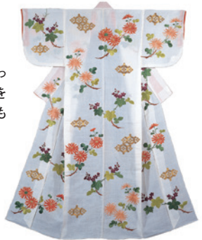
帷子 和宮着用 (江戸時代末期)

所蔵品の中から着用者、所有者、着用の機会などの由来のわかっ ているものを厳選、江戸時代後期から昭和時代にかけての衣服を 通して着用者の人となりや服が着られた時代の社会的背景をひも ときます。初出品となる岡本太郎の手描きの柄のドレスも必見。