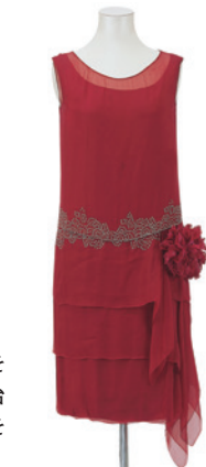
ドレス 大正末期~昭和初期

日本人と洋服の150年 日本人が洋服を着始めておよそ150年が経ちます。日本人がどのように洋服を受け入れ、今日世界に独自のファッション性を発信するまでになったかを、明治初期の洋装からバリ・コレクションに進出した日本人デザイナーの作品までを展覧しながら探ります。